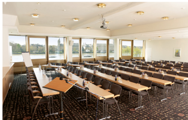
Ehrenbreitstein 1 & 2 (200 qm)