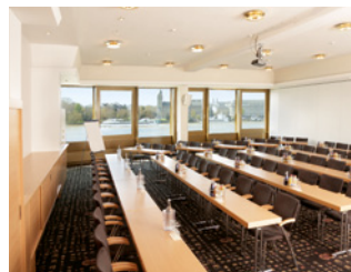
Ehrenbreitstein 1 (150 qm)

Der Raum ist durch eine schalldichte Mobilwand in zwei Räume (Ehrenbreitstein 1 und Ehrenbreitstein 2) teilbar. Der Raum ist über einen Aufzug (2,10 m x 1,20 m, Tür 0,90 m) von außen erreichbar.