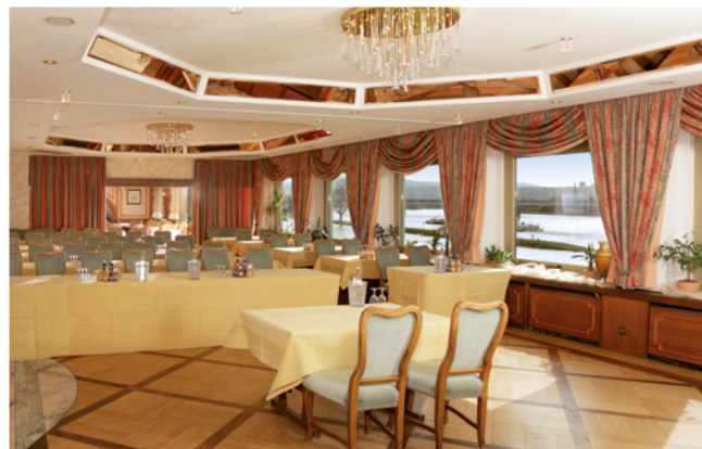
Terrasse 1 & 2 (94 qm)